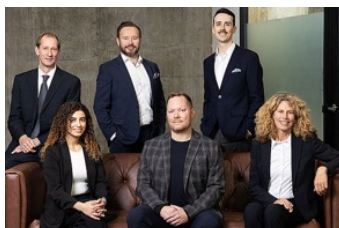
reconcept Canada: Team Toronto

Der Ausbau der Erneuerbaren Energien ist als ein zentraler Bestandteil der kanadischen Klimaschutzstrategie gesetzlich verankert. 1 Das Land bietet ein großes Potenzial für Projektentwickler, bis dato sind die Wind- und Solarenergie-Ressourcen weitgehend ungenutzt. Der Fokus von reconcept liegt auf dem